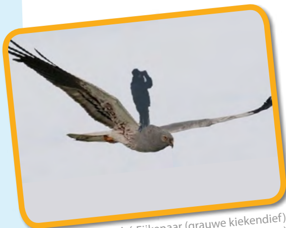
(grauwe kiekendief) (vrijwilliger)

Over informatie verzamelen en vrijwilligers gesproken: onze wintertellingen zijn weer begonnen. Rond de 25 vrijwilligers gaan weer mooie reeksen verzamelen. Getalletjes die vroeg of laat in onze publicaties terecht komen en een rol blijven spelen in het verder ontwikkelen van effectieve vormen van natuurbeheer in akkerbouwgebieden. Schroom niet te bellen of te mailen als je een keer mee wilt.