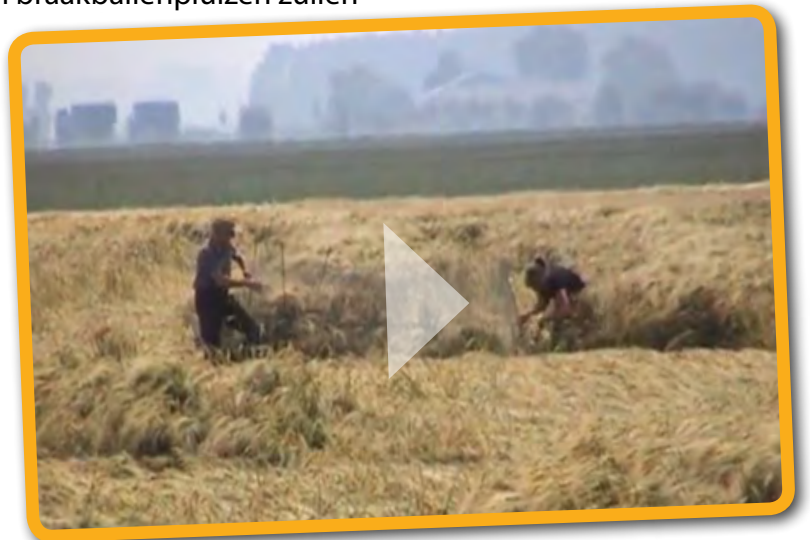
Momentopname uit de film van Guus van Duin.

Het meest succesvolle paar met vier uitgevlogen jongen zat in Flevoland. Een paar dat pas laat werd gevonden in een voor grauwe kiekendieven bijzonder smal wintergerstperceel van 32 meter breed. Klik op het filmbeeld om de door Guus van Duin gemaakte film te bekijken over het plaatsen van bescherming bij dit nest.