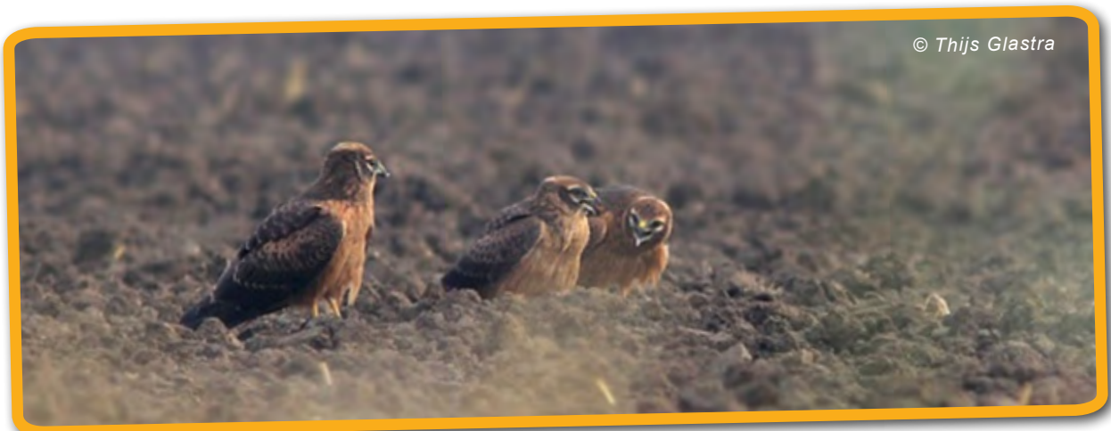
De drie uitgevlogen jongen van het webcamnest, 12 augustus 2013

9 augustus - de webcam gaat op zwart, van de vier jongen zijn er drie succesvol uitgevlogen.