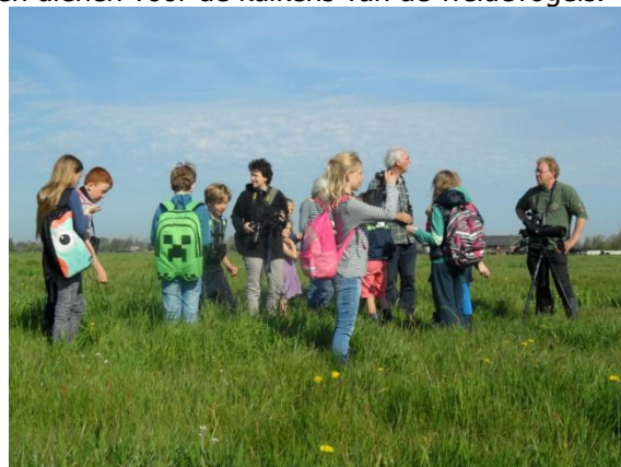
Kas als grutto in het lange gras

Terug in het clubhuis hebben we gezamenlijk de vogelwaarnemingen weer in ons logboek gezet. We hebben op deze excursie 23 vogelsoorten gezien, waarbij een aantal voor de eerste keer.