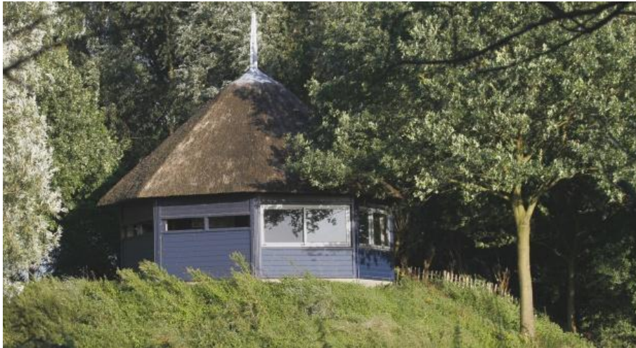
Vogelkijkhut in De Blauwe Kamer

Bij deze laatste excursie zijn ook jullie ouders van harte welkom.