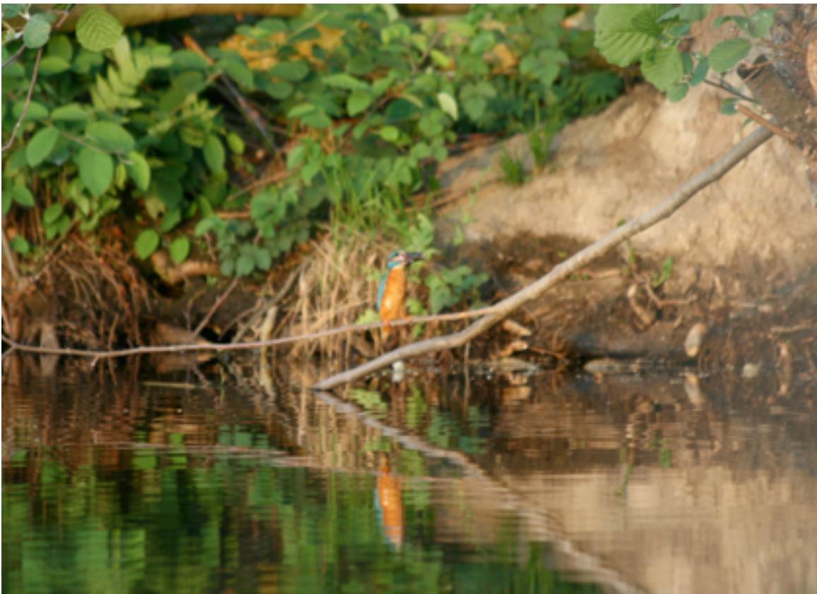
Ijsvogel, man, met visje in de bek, vlak voor de nestingang bij de ijsvogelwand, 12 mei.