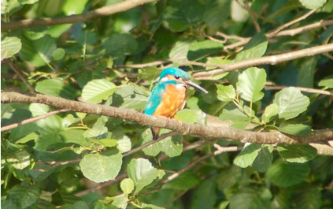
IJsvogel, man (snavel volledig zwart), in de elzenstruiken bij de ijsvogelwand, 10 juni.

Een fotoreportage gemaakt door natuurfotograaf Cees Struijk en Ruud van Middelkoop .