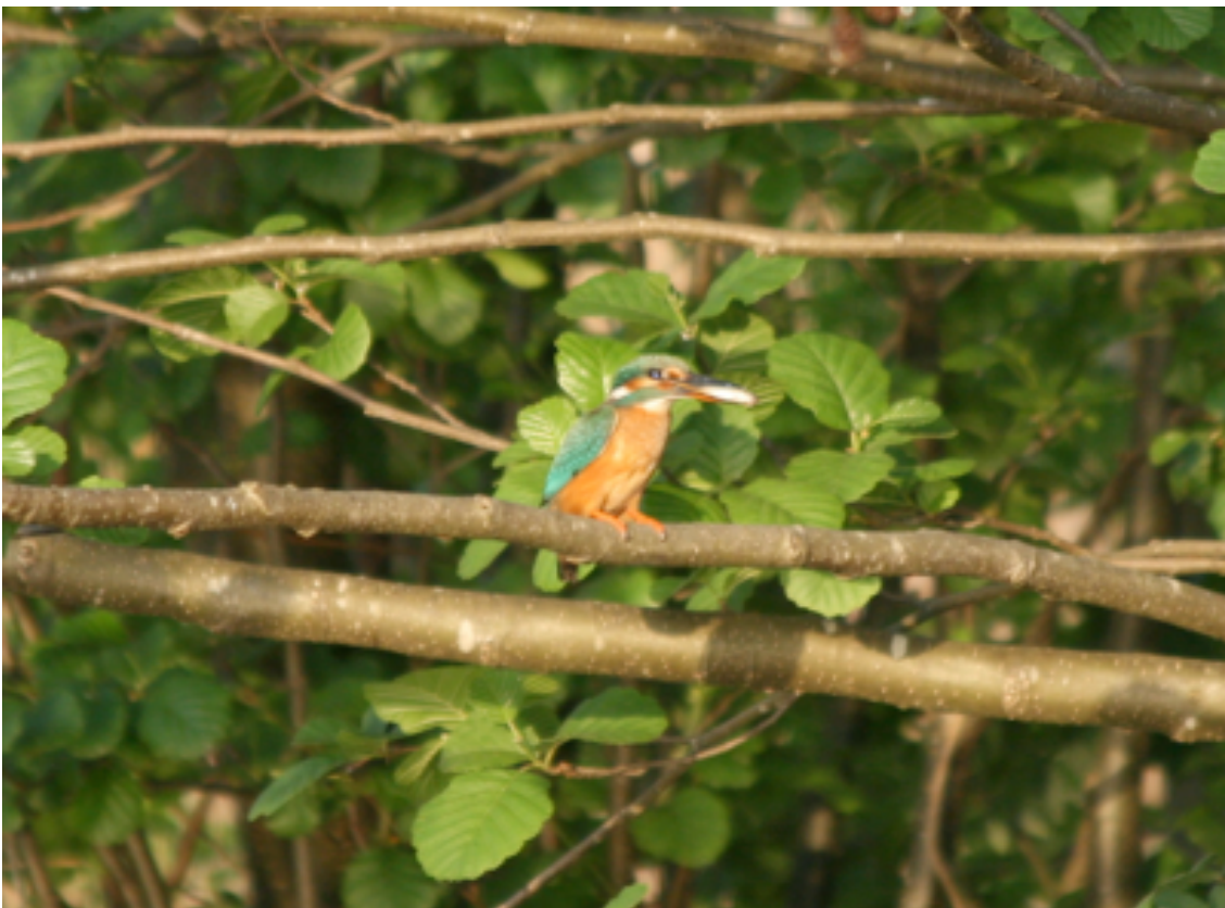
IJsvogel, vrouw (ondersnavel rood), met visje voor de jongen, 12 mei.