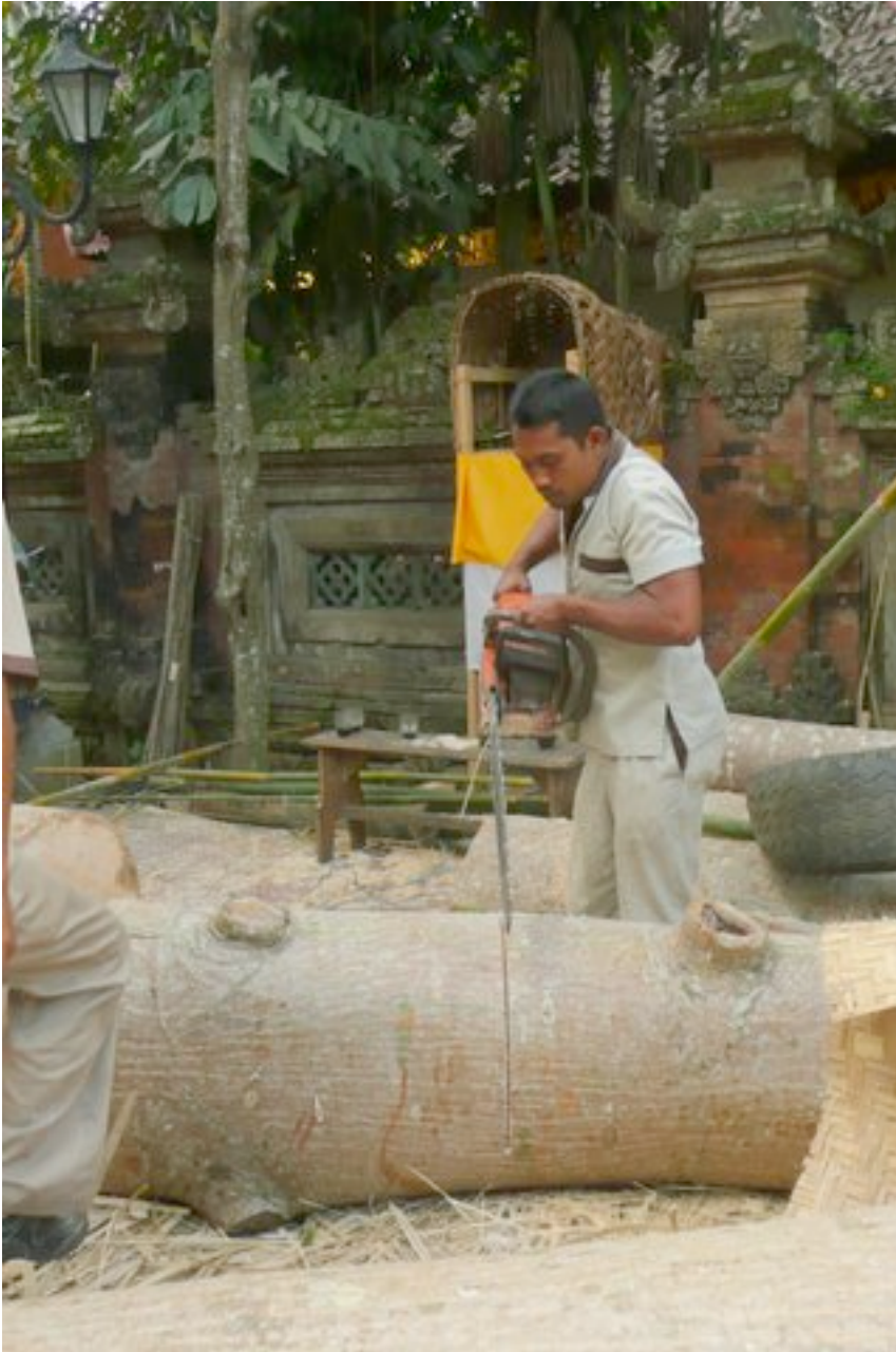
Foto gemaakt op Ubud - Bali