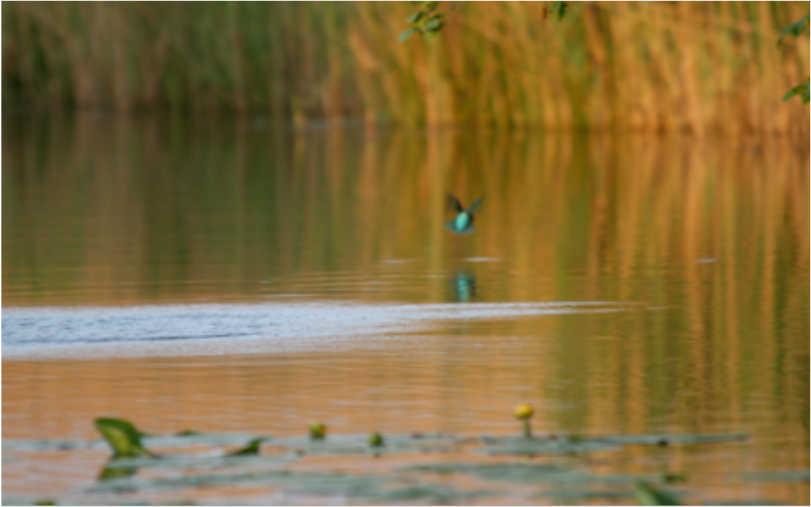
Zo zien we de ijsvogel meestal, een "blauwe flits" die laag over het water voorbij vliegt , 12 mei