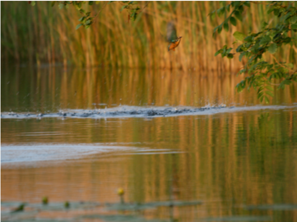
Na elk bezoek aan de nestgang neemt de ijsvogel een duik om zijn verenpak op te frissen, 12 mei