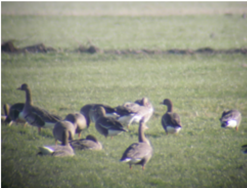
Kolganzen Demmerikse Polder

Voor de komende maanden maart en april staan de vogels rond huis en tuin en de weidevogels op het programma. Met excursies naar het landgoedbos Over Holland bij Breukelen en de polders bij Donkere eind en Bosdijk.