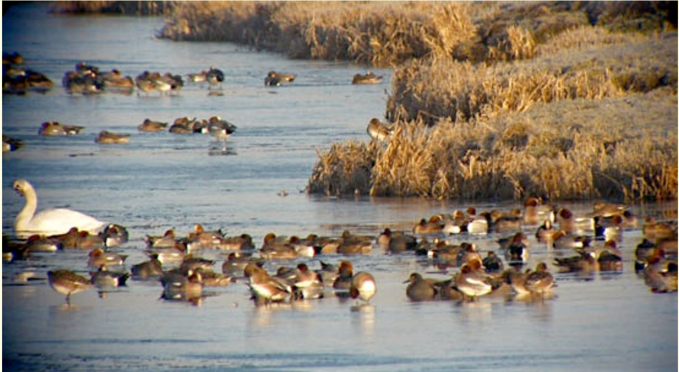
Poldersloot met smient, krakeend, knobbelzwaan en meerkoet

Op menig hek of paaltje zat een torenvalk of buizerd. En er werden diverse Grote Zilverreigers gezien.