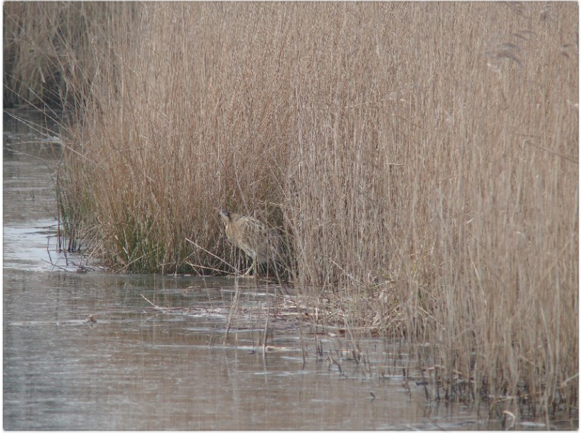
Foto gemaakt door Betty van Middelkoop, 6 februari, Polderreservaat Kockengen.

In de afgelopen winterperiode is de roerdomp weer gesignaleerd in het Polderreservaat te Kockengen. Eén van de wensen van de Natuurgroep Kockengen is de roerdomp weer terug te krijgen als broedvogel in Kockengen. Elke winter is er wel een roerdomp die vanuit Oost-Europa een poosje komt overwinteren. Hopelijk wordt dit een blijvertje. Op 18 februari heeft Theo van Schie een roerdomp waargenomen langs de Wagendijk ter hoogte van de Schutterskade.