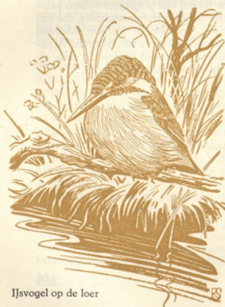
Ijsvogel op de loer