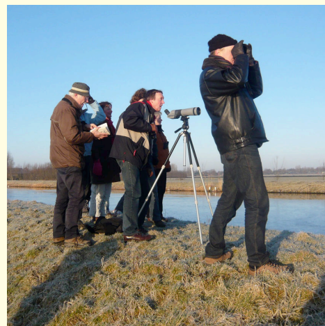
Vogels kijken op de dijk langs Groot Heicop