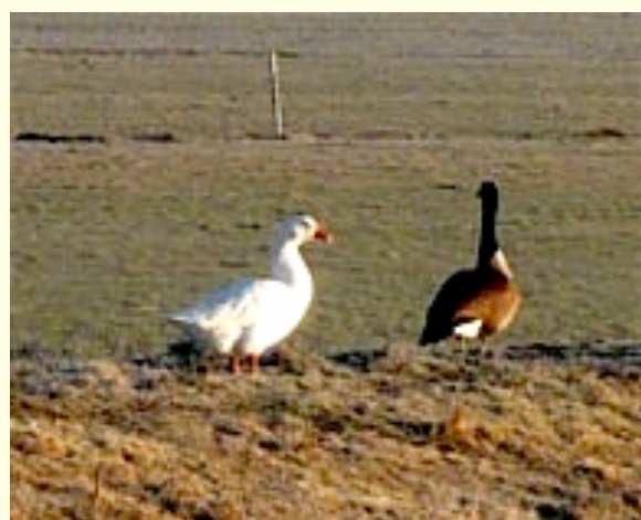
Soepgans en Grote Canadagans