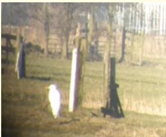
Grote Zilverreiger en Slechtvalk

Spectaculair was de waarneming van een jagende slechtvalk die een smient probeerde te verschalken. En dat deze slechtvalk op een paal neerstreek vlak naast een grote zilverreiger. Via de telescoop zijn er foto's van gemaakt. Deze zijn helaas niet zo scherp, maar de vogels zijn nog wel herkenbaar.