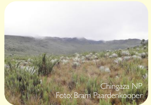
Chingaza NP

Ten noordoosten van Bogota ligt het Chingaza National Park. Het park ligt gedeeltelijk in de zogenaamde Paramozone met haar kenmerkende flora en fauna.