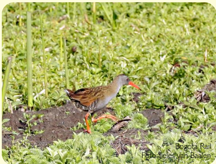
Bogota Rail

► ning de Apolinar's Wren. We hebben ze allebei gezien.