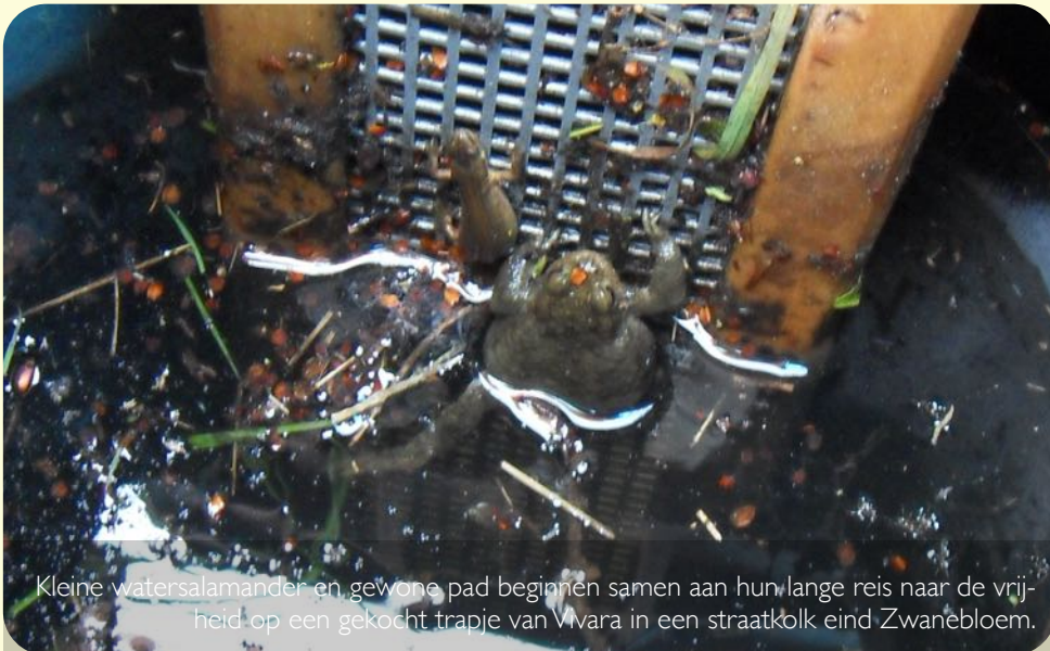
Kleine watersalamander en gewone pad beginnen samen aan hun lange reis naar de vrijheid op een gekocht trapje van Vivara in een straatkolk eind Zwanebloem.