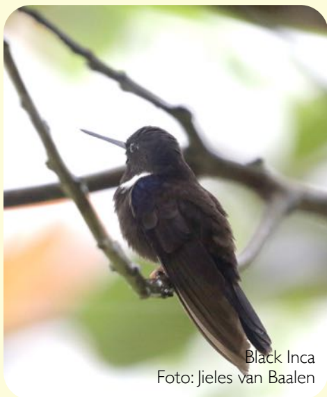
Black Inca

Dichtbij Bogota aan de rand van de stad is een soort stadspark, het La Florida Park, waarvan een deel alleen toegankelijk is gesteld voor birders. Het is een meertjesgebied met mooie rietvelden en oeverzones. In dit gebied komt de uiterst zeldzame Bogota Rail voor en een nog zeldzamer soort Winterko- ➤