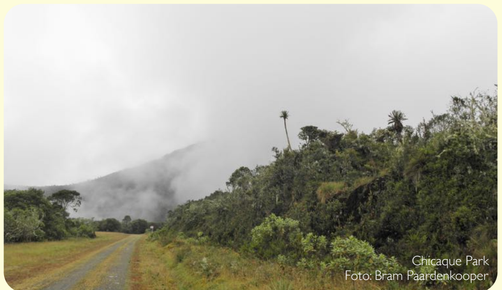
Chicaque Park