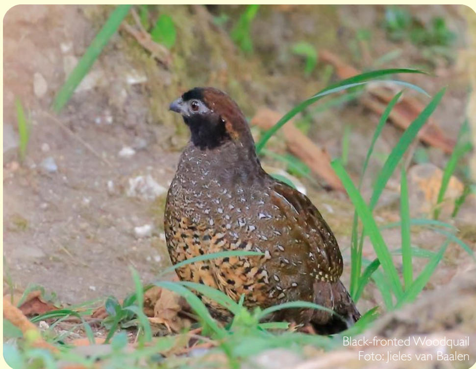
Black-fronted Woodquail