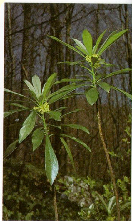
Zwart peperboompje, bloeiend

Hij komt bij voorkeur in schaduwrijke of halfschaduwrijke struwelen voor.