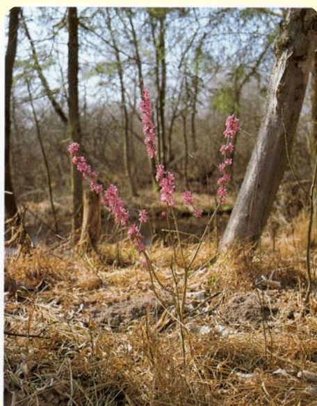
Rood peperboompje in natuurlijke biotoop

Beide boompjes zijn weinig vertakt en worden hooguit 1,5m. De bladeren zijn kort gesteld, langwerpig lancetvormig. Het Rood Peperboompje verliest het loof heeft zachtgroene blaadjes