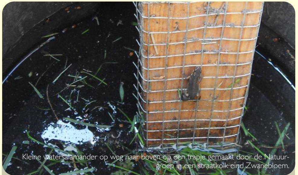
Kleine watersalamander op weg naar boven op een trapje gemaakt door de Natuurgroep in een straatkolk eind Zwanebloem.

“Trapjes in waterputten (straatkolken) maken Kockengen nu ook kikkerproof” stond er boven een artikel in het AD van 5 mei j.l.