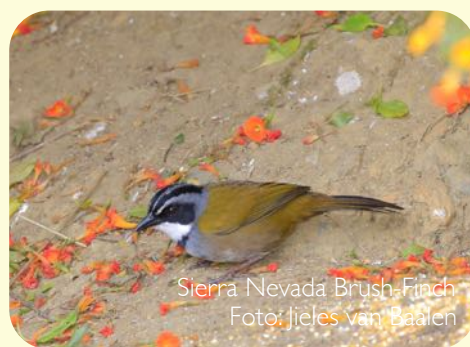
Sierra Nevada Brush-Finch