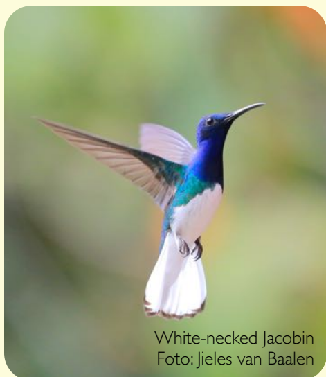
White-necked Jacobin

Met een inlandse vlucht het berggebied boven Santa Marta bezocht. Dit berggebied ligt wat geïsoleerd en vormt het laatste noordelijk gelegen deel van de Andes. Bergopwaarts kan alleen met een stevige 4WD. Onderweg komen we door diverse hoogtezones, waar prachtige vogels te zien zijn, zoals de White-necked Jacobin en andere Hummingbirds.