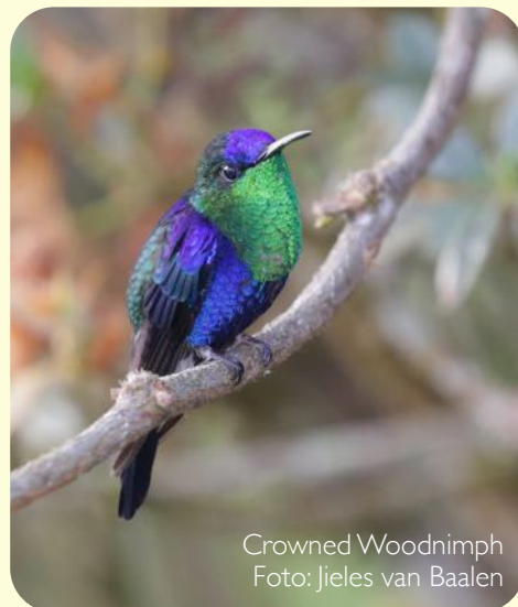
Crowned Woodnymph Foto: Jieles van Baalen

Tekst: Bram Paardenkooper Foto's: Zie bijschriften