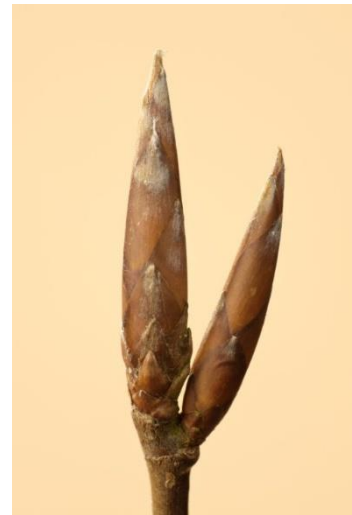
Koppen van de beuk

Het gaat ons primair om de bomen en struiken, maar we zullen vast ook wel kijken en luisteren naar de daar aanwezige vogels (veel boomklevers!). Het voorjaar kondigt zich aan en de eerste vogels laten hun lied al horen.